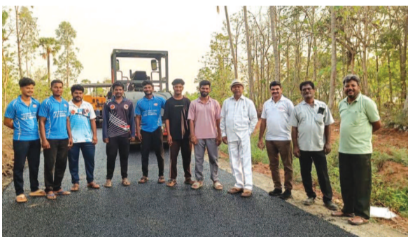
విస్సం మేరకు దివిస్ కంపెనీ బీటీ రోడ్డు పూర్తి చేయడం జరిగింది. ఈ కార్యక్రమంలో గ్రామ పెద్దలు యువత పాల్గొన్నారు.