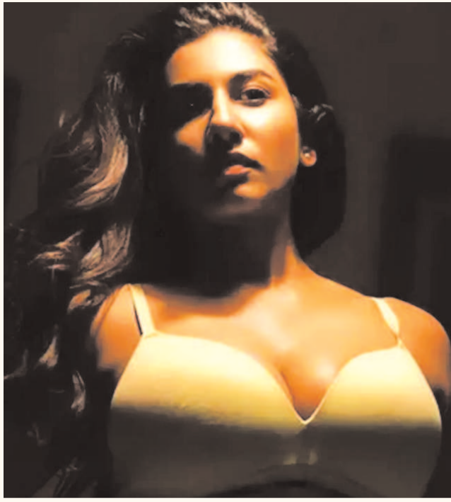
ఫోటోగ్రఫీ కోసం గ్లామర్...