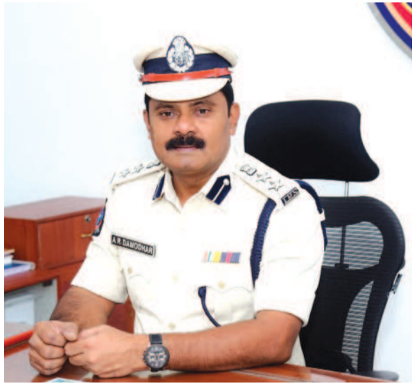
- విజయనగరం జిల్లా ఎస్పీ ఎ.ఆర్.దామోదర్,ఐ.పి.ఎస్.,

వెళ్ళింది, ఎవరితో స్నేహం చేస్తున్నది, వారు ఏమి చేస్తున్నది గమనించాలని తల్లిదండ్రులకు జిల్లా ఎస్పీ ఎ.ఆర్.దామోదర్ సూచించారు.వేసవి కాలంలో దొంగతనాలను నియంత్రించేందుకు జిల్లా పోలీసుశాఖ వైట్ ఫెల్డ్రోలింగును, గస్తీని ముమ్మరం చేస్తున్నప్పటికీ, ప్రజలు కూడా దొంగతనాల నియంత్రణకు తమవంతు బాధ్యతగా కొన్ని జాగ్రత్తలను పాటించాలని కోరారు. ప్రజలు అప్రమత్తంగా ఉంటూ దొంగతనాలు జరగకుండా కొన్ని జాగ్రత్తలు పాటించాలని కోరుతూ జిల్లా ఎస్పీ ఎ.ఆర్.దామోదర్ కొన్ని సూచనలు చేసారు.కొన్ని ముఖ్యమైన సూచనలు ఇంటిపై నిఘా పెట్టుకోవడం ఇంటి పరిసరాల్లో సిసి కెమెరాలను ఏర్పాటు చేసుకోవాలి. ఇంటిలోకి ఇతరులు ప్రవేశించకుండా తలుపులను, కిటికీలను వేయాలని, బలమైన గడియలను, తాళాలను వేయాలన్నారు. ఇండ్లను తరుచూ గమనించే విధంగా నమ్మకమైన వ్యక్తులకు సమాచారం అందించాలన్నారు రాత్రి సమయాల్లో ఇంటి ఆవరణలో లైట్లు వెలిగి చూడాలన్నారు ఇంటి పరిసరాల్లో అవరిచిత వ్యక్తులు తిరుగుతున్నట్లయితే స్థానిక పోలీసులకు తేదా డయల్ 100/112కు సమాచారం అందించాలన్నారు విలువైన వస్తువులను, ఆభరణాలను ఇంటిలో ఉంచకుండా జాగ్రత్తలు తీసుకోవాలన్నారు. వాటిని బ్యాంకు లాకర్లలో భద్రపర్చుకోవడం ఉత్తమమన్నారు బయట ప్రాంతాలకు వెళ్ళుతున్న విషయాలును సోఫట్ మీడియాలోను, వాట్సాప్ స్టేటస్ లో పెట్టవద్దని ప్రజలకు సూచించారు