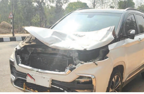
బదుగురికి గాయాలు, ఒకరి పరిస్థితి విషమం

భీమునిపట్నం, ప్రజాస్వామ్యం మండలం లోని దాకమర్రి జంక్షన్ వద్ద మంగళవారం అర్ధరాత్రి ఓ కారు బీభత్సం సృష్టించింది. విశాఖ నుంచి విజయనగరం వెళ్తున్న కారు తొలుత రోడ్డు పక్కన బైక్పై ఉన్న ఇద్దరు యువకులను, అనంతరం రోడ్డు దాటుతున్న మరో ముగ్గురిని వేగంగా ఢీకొట్టింది ఈ ప్రమాదంలో బదుగురికి తీవ్ర గాయాలవ్పగా, ఒకరి పరిస్థితి విషమంగా ఉంది. క్షతగాతులను స్థానికులు ఆస్పత్రికి తరలించారు. ప్రమాదం అనంతరం కారు డ్రైవర్ పరారయ్యాడు. భీమిలి పోలీసు కేసు నమోదు చేసి దర్యాప్తు చేస్తున్నారు.